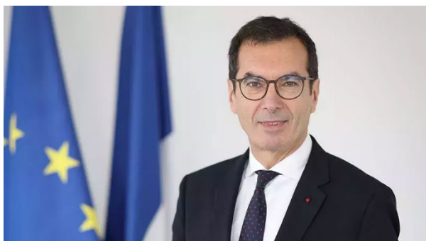
Jean-Pierre FARANDOU, ministre du Travail et des Solidarités

Les comités territoriaux pour l'emploi, créés par la loi pour le plein emploi du 18 décembre 2023, ont essaimé sur le territoire national depuis 18 mois. Aujourd'hui, la France dénombre 470 comités territoriaux pour l'emploi, parmi lesquels 361 comités locaux pour l'emploi.